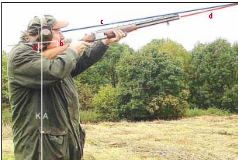
a = Senkung Schaftende, b = Senkung Wangenanlage, c = Visierlinie

Möchte man alle Anschlag- und Schießfehler beschreiben, die beim Flintenschießen möglich sind, so würde man sich, wenn man ein Buch darüber schreiben wollte, nicht sicher sein, ob man wirklich alle Mängel zu Papier bringen könnte. Es gibt unendlich viele Fehlerquellen. Hier und in den nächsten Kapiteln die häufigsten und gravierendsten Anschlagfehler.